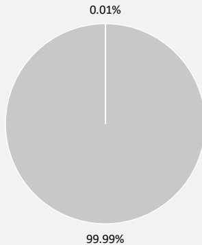
2. 投資與分類規則之一致性 排除主權債券*